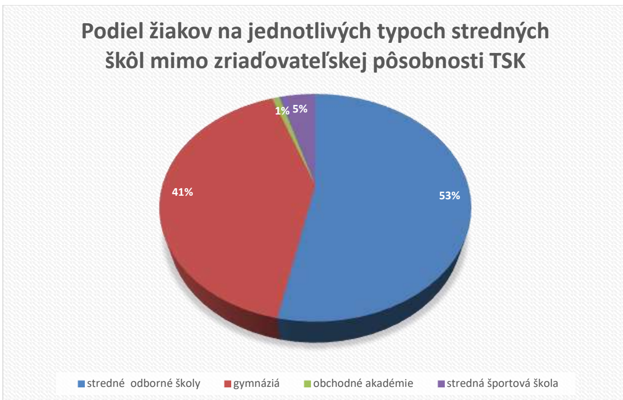
Graf č. 2: Podiel žiakov na jednotlivých typoch stredných škôl mimo zriaďovateľskej pôsobnosti TSK

Percentuálne zastúpenie žiakov na jednotlivých typoch škôl mimo zriaďovateľskej pôsobnosti TSK je znázornené na grafe č. 2.