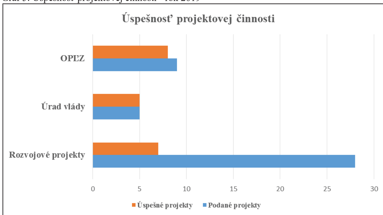
Graf 5: Úspešnosť projektovej činnosti - rok 2019