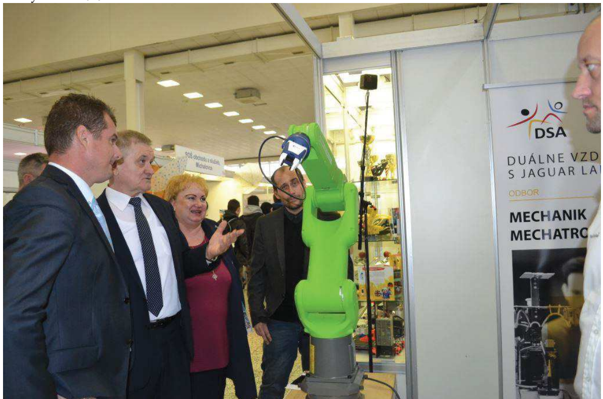
Mladý tvorca 2019

Odbor školstva ÚNSK každoročne vydáva Študentský servis (brožúru s ponukou vzdelávania všetkých stredných škôl v územnej pôsobnosti NSK).