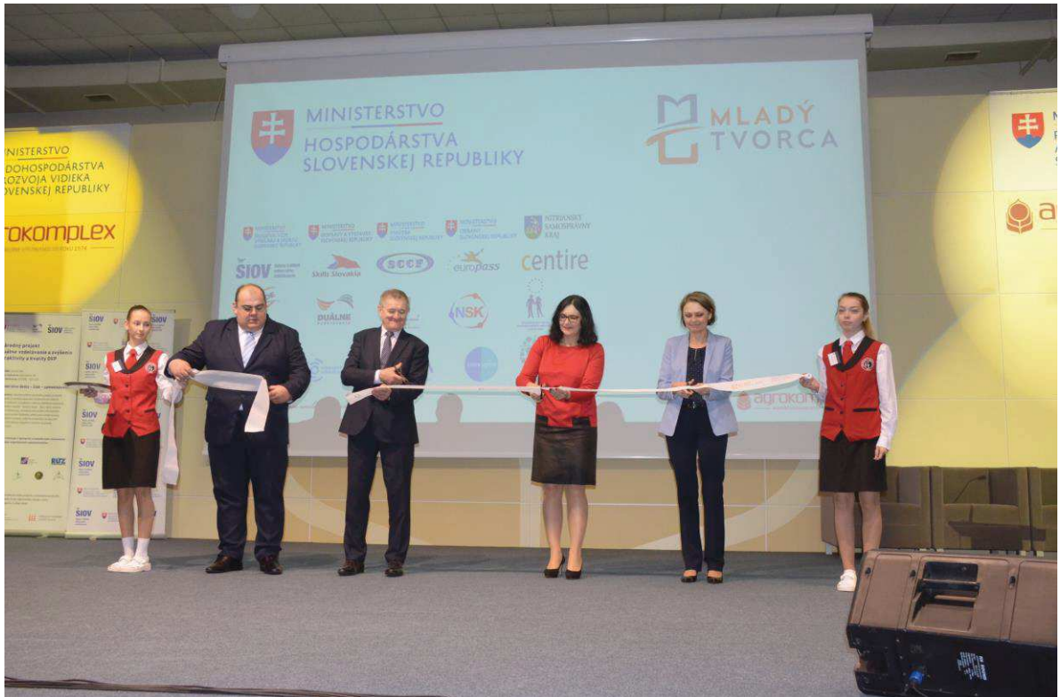
Mladý tvorca 2019